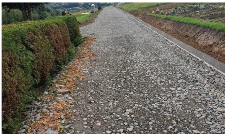
Droga „Odrończa” – Laskowa