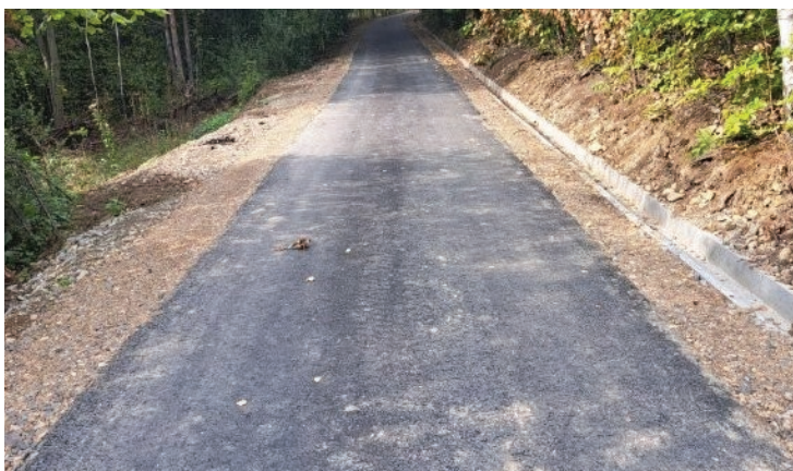
Droga „Pustki-Rośkówka” – Kamionka Mała