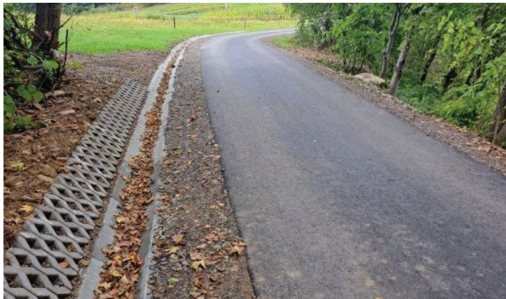
Droga „Kowalówka” – Kobyłczyzna i Żmiąca